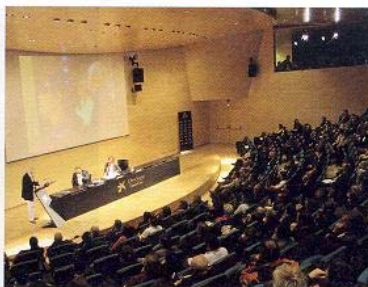
Un momento de la entrega de premios

nuevas perspectivas a la plaza donde se coloca, por la expresividad de la volumetría exterior y por la riqueza espacial de los ambientes interiores, el jurado decidió otorgar el Premio de Arquitectura 2006 a la obra Biblioteca Jaume Fuster en Barcelona de la que son autores los arquitectos Josep Llinàs y Joan Vera.