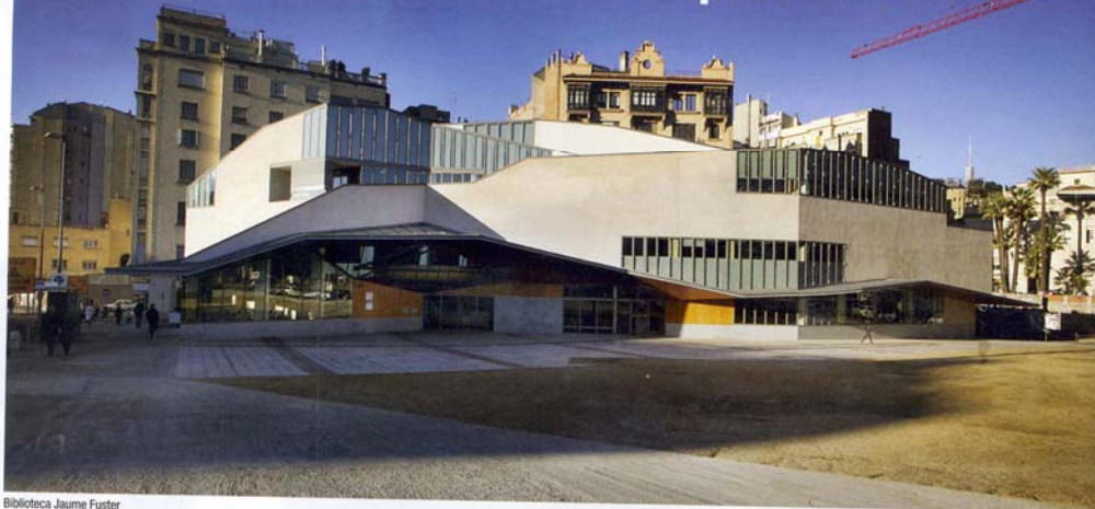
Biblioteca Jaume Fuster